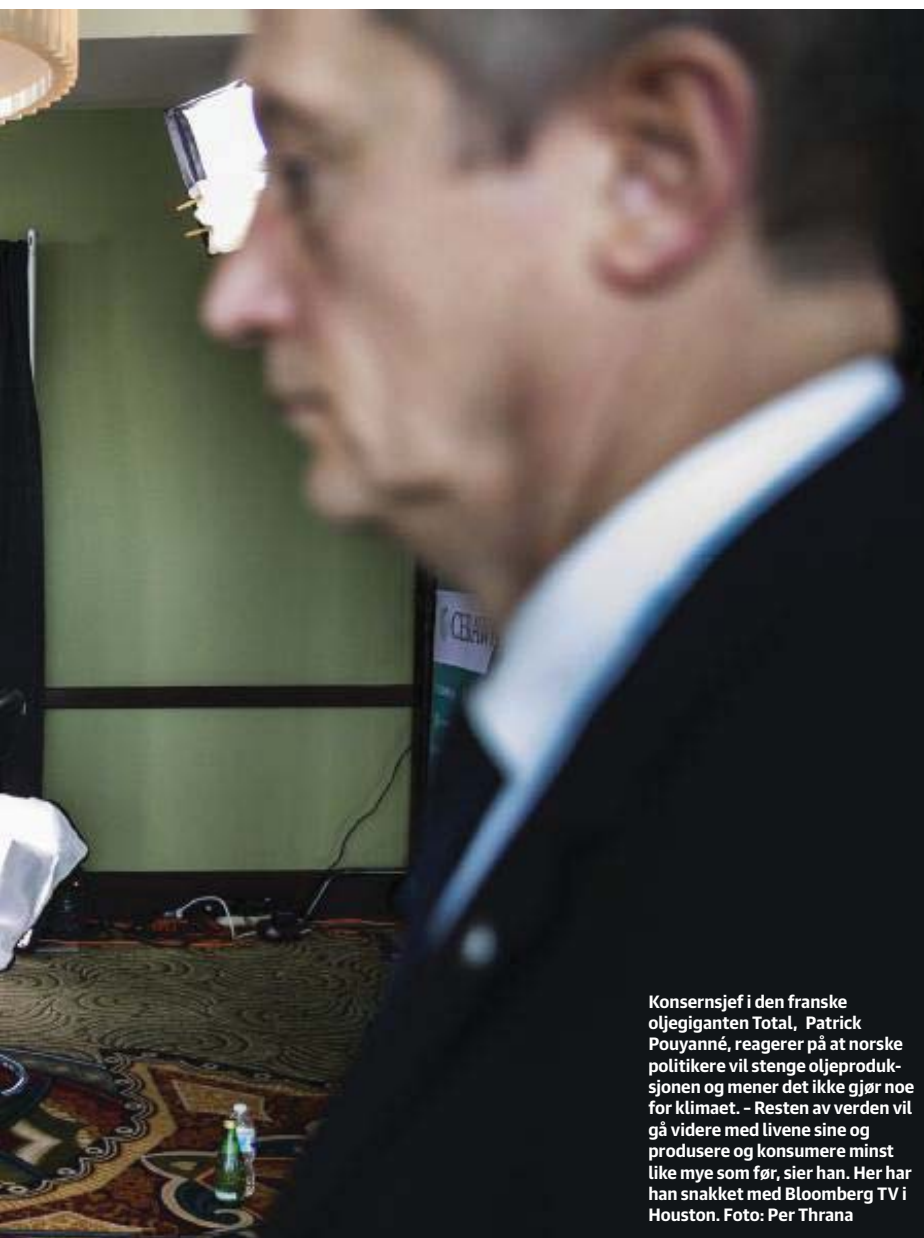
Konsernsjef i den franske oljegiganten Total, Patrick Pouyanné, reagerer på at norske politikere vil stenge oljeproduksjonen og mener det ikke gjør noe for klimaet. – Resten av verden vil gå videre med livene sine og produsere og konsumere minst like mye som før, sier han. Her har han snakket med Bloomberg TV i Houston.